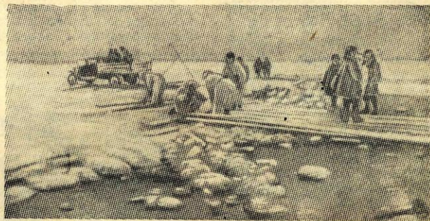
Быстро наводили дорожники мосты через трещины во льду Ладожского озера, не допуская заминок в движении машин