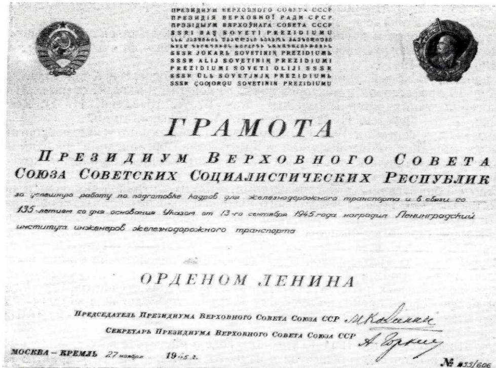
Грамота Президиума Верховного Совета СССР